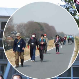
▲2013年 チャリティー ウォークの様子