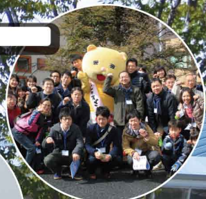
▲2012年 チャリティー ウォークの様子