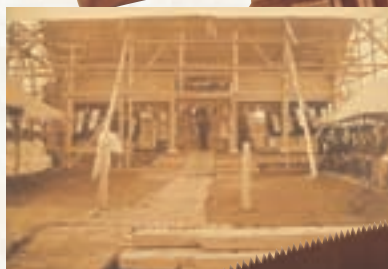
大宮氷川神社 上棟式