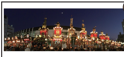
審査員特別賞「平成最後のうちわ祭り始まりました」