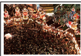
林喜一賞「熊谷の一番熱い夜」