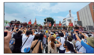
審査員特別賞「カメラの熱(庄)」