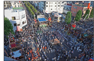
最優秀賞「夕方の集合」