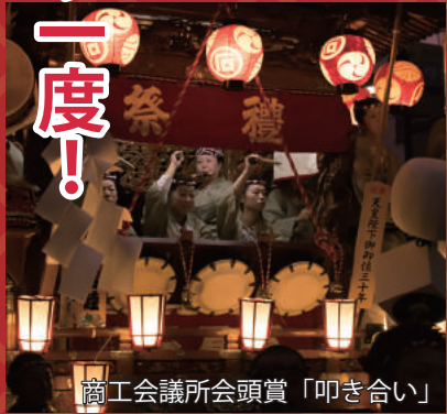
商工会議所会頭賞「叩き合い」