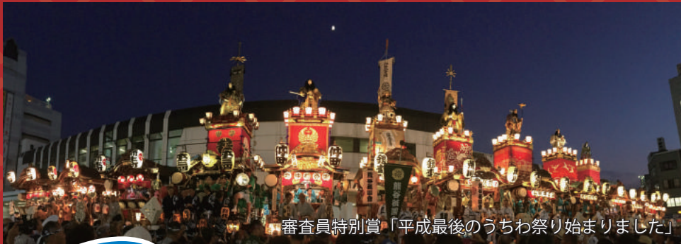
審査員特別賞「平成最後のうちわ祭り始まりました」

2019年 入賞・入選作品を中心に、作品を展示します。 皆様、お誘いあわせのうえご来場ください。