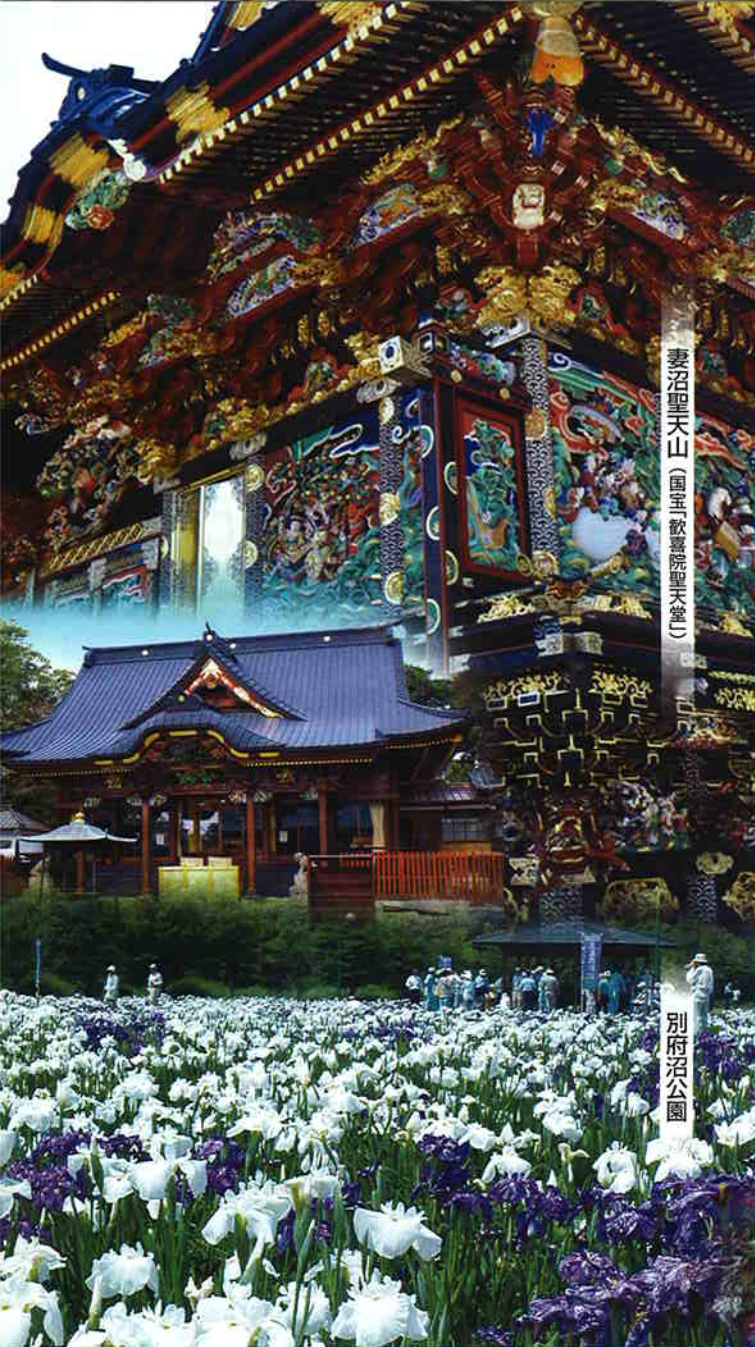
妻沼聖天山 (国五 歡喜院聖天堂)