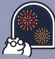
お家から見える花火