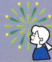
花火を見上げる横顔