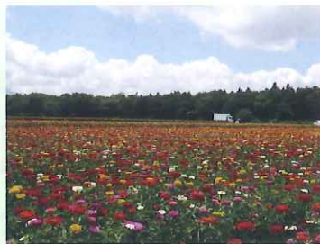
天国は こんなところと 下見する