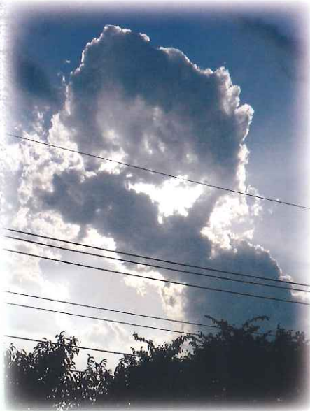
過ちを いくつ重ねて 雲の峯