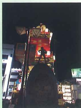
胸を張り わが街一番 あつい街