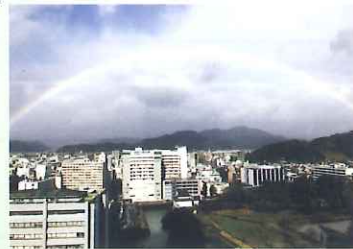
窓際に 上ぐる喚声 春の虹