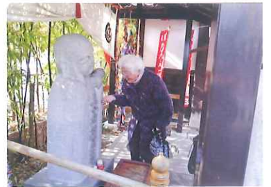
お元氣と 笑顔の2人 手をにぎる