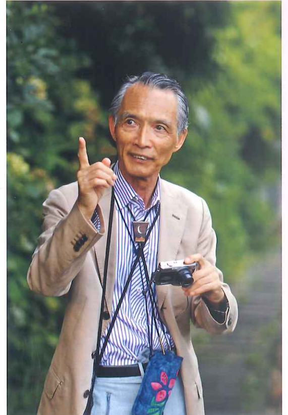
森村誠一氏