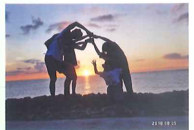
夕やけと 家ぞくつつんだ 海の風