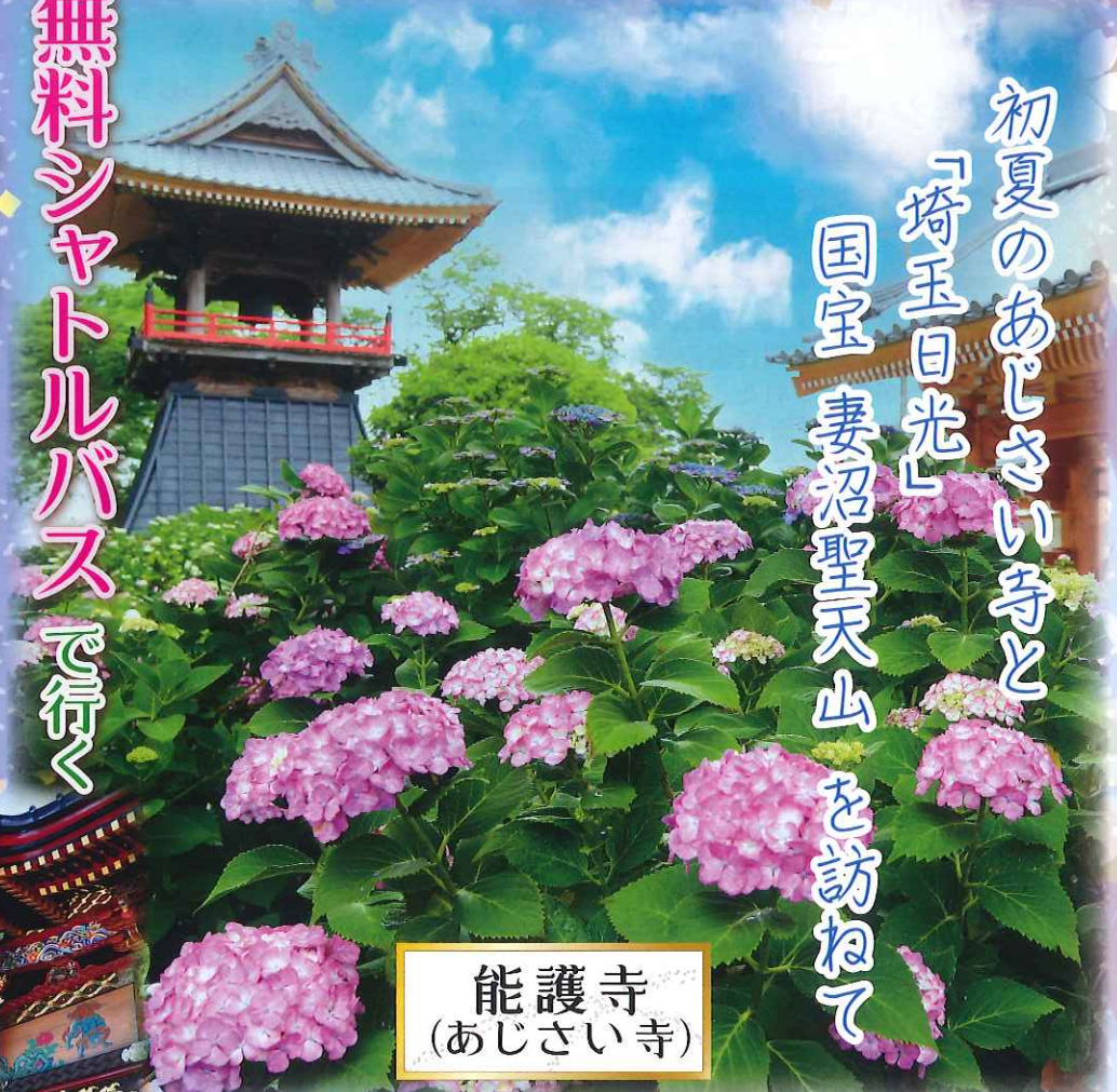
能護寺 (あじさい寺)