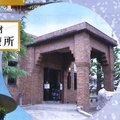
国登録有形文化財 坂田医院旧診療所