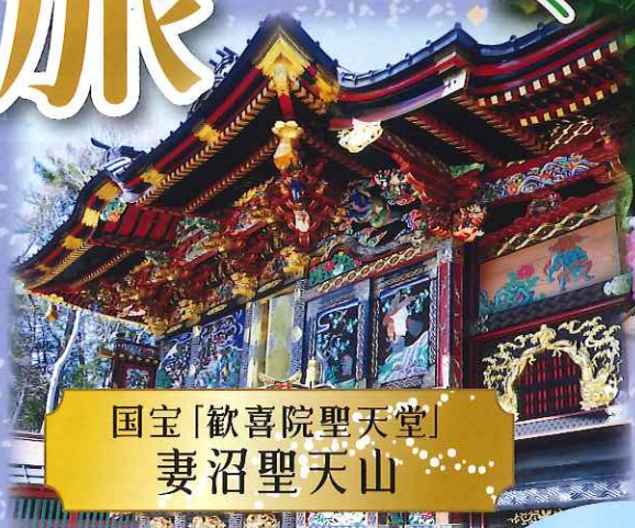
国宝「歡喜院聖天堂」 妻沼聖天山