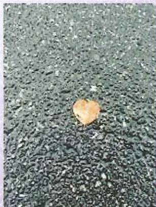
雨の日に誰かの落とした恋心