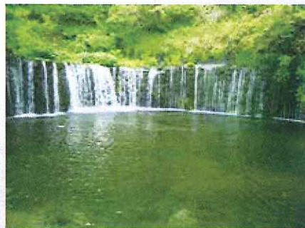
見るまでは音ばかりなり迷い瀧