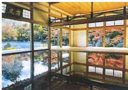
正直な心でいたいと思う日々