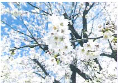
かくれんぼ桜に呼ばれてほくの負け