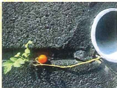
えんてい ゆず 炎帝や我が反骨は親譲り