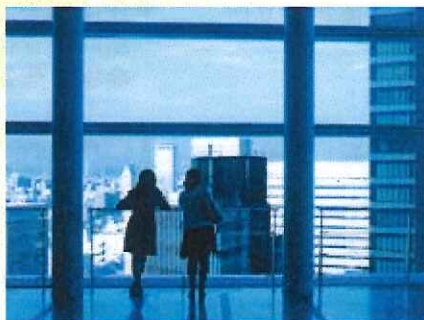
どんな夢開く明日や影長し