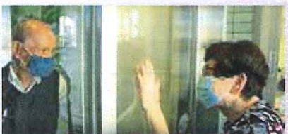
七夕の願ひかなえし夫婦あり