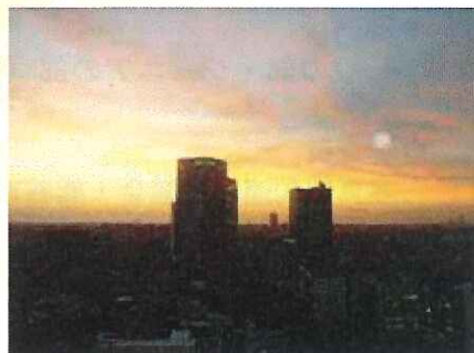
今日もまた未練の色や秋の暮