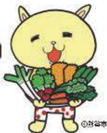
熊谷市マスコットキャラクター「ニャオさね」