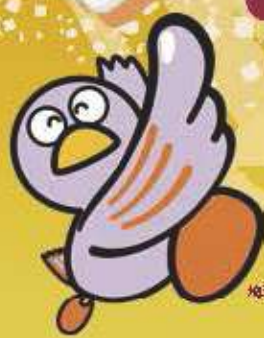
埼玉農マスコット「コバトン」