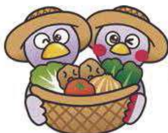
埼玉県マスコット「コバタン」&「さいたままる」

国道17号熊谷バイパス<肥塚交差点>または熊谷スポーツ文化公園入口交差点から約700m(交差点に案内標識が設置されています) ※車にて来場する場合、交通渋滞、駐車場不足が予想されますので、公共交通機関等のご利用をお願いいたします。