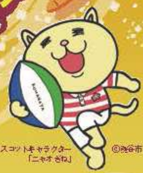
熊谷市マスコットキャラクター「ニャオさね」